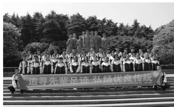
●同学们在雨花台烈士陵园烈士就义群雕前留影