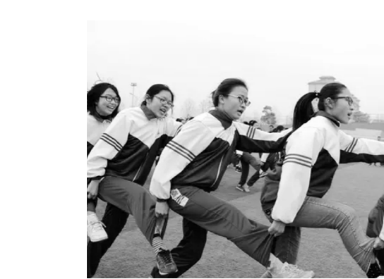
●第十届“校园吉尼斯”运动会跑操